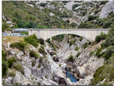
Aqueduc au dessus des gorges de l'Hérault