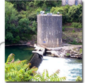
Barrage de Belbezet