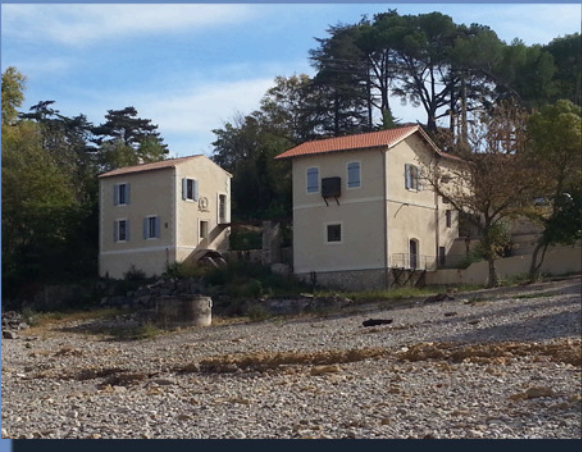
Ancienne usine hydroélectrique